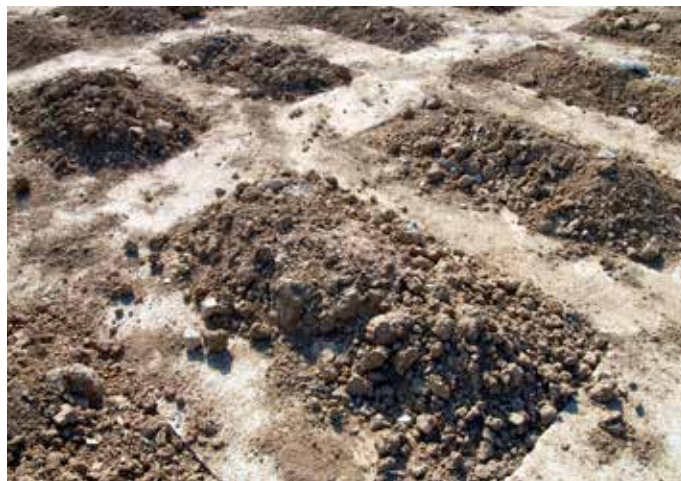
Seol [del hebreo sheol]: Hoyo, sepultura, agujero en la tierra.

Muchos quedarán asombrados al saber que estas vívidas imágenes no vienen de la Biblia. ¡El infierno de las Escrituras no es el que Dante pintó! Siendo así, entonces hay que preguntar qué es el infierno y dónde se encuentra. El pasaje de Mateo 10 mencionado nos da la respuesta en parte. La palabra que Jesús empleó para “infierno” en Mateo 10:28 fue “ gehena ” y se refiere