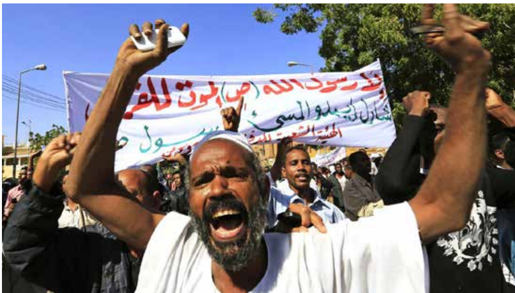
Las caricaturas de Mahoma en un diario danés en el 2005, provocaron la ira que continúa hasta ahora en el mundo islámico.

“La Santa Sede no puede menos que expresar su aflicción por la oposición de algunos gobiernos al reconocimiento explícito de las raíces cristianas de Europa. Se trata de