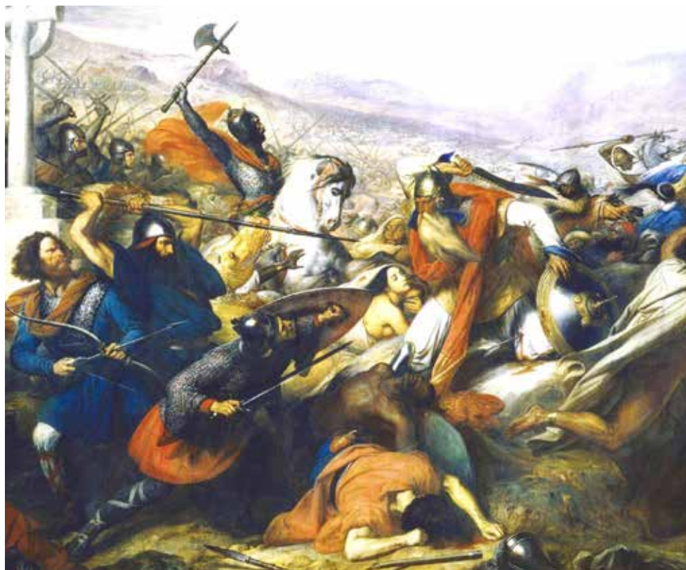
La batalla de Poitiers en el año 732 del ejército Franco contra los musulmanes, marcó un hito decisivo en la historia occidental.

¿Sería Francia un país musulmán? Históricamente estuvo a punto de suceder, pero ante la feroz oposición de Carlos Martel, que puso fin a las incursiones musulmanas y estableció las bases para siglos de lucha de allí en adelante, el Islam no siguió