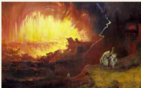
El Eterno hizo llover fuego y azufre sobre Sodoma y Gomorra por sus pecados.

durante 120 años advirtió a su generación que su fin se acercaba (Génesis 6:3); pero solo ocho personas, él y su propia familia, hicieron caso. Los yernos de Lot pensaron que “se burlaba” cuando les dijo que huyeran de Sodoma porque la ciudad sería destruida (Génesis 19:14). El profeta Ezequiel advirtió reiteradamente a las naciones de