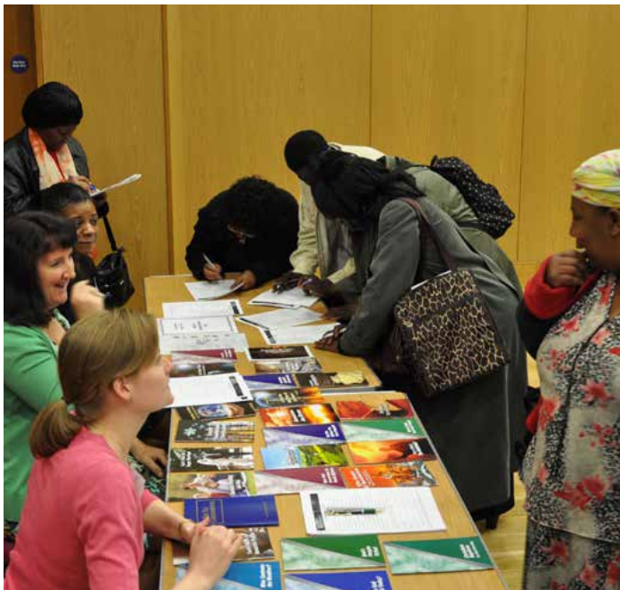
En el ingreso a una de nuestras presentaciones especiales de El Mundo de Mañana , se ofrece gran variedad de publicaciones gratuitas a los invitados.

Es posible que Dios le esté llamando a usted para que sea uno de sus líderes en el mundo de mañana. En ese caso, Él espera su respuesta. ¿Hará usted su parte? Ruego a Dios que así sea.