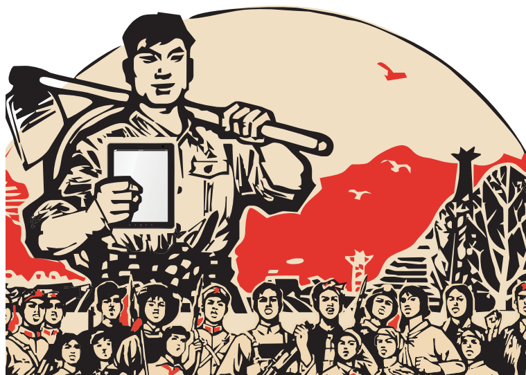
El comunismo chino daba especial énfasis a los agricultores campesinos como la fuerza populista principal.

Los comienzos de esta potencia político religiosa se están viendo ya en el continente europeo. La potencia parecerá “hacer el bien” al principio, pero terminará por tomar las