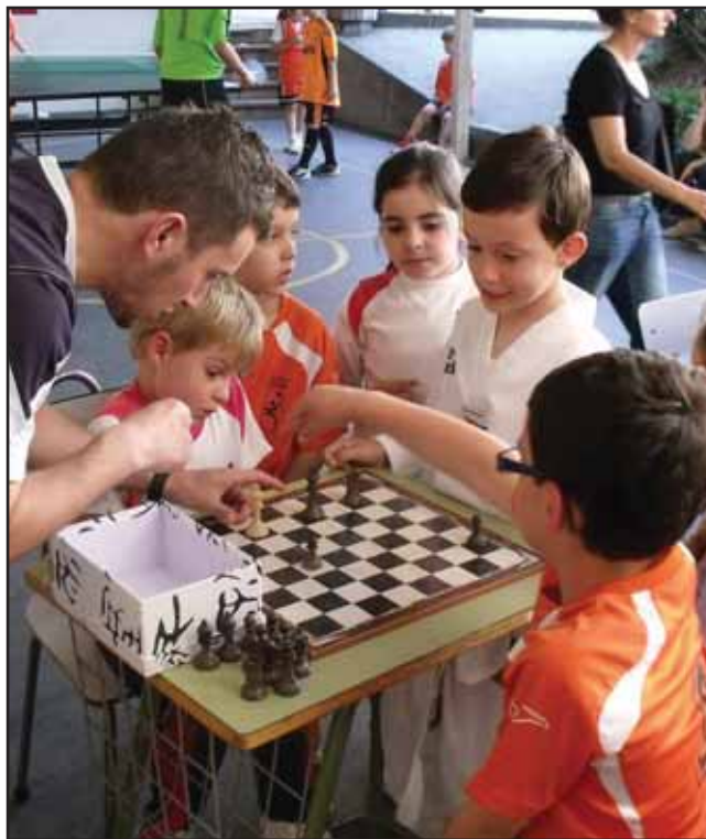
También recibimos corrección de los maestros, entrenadores, consejeros en los campamentos de verano, de los ministros y muchas personas más

Si bien debemos estar dispuestos a recibir la corrección y deseosos de arrepentirnos para cambiar y crecer, no debemos caer en el temor constante de las críticas. Recordemos un principio de Dios, que mu-