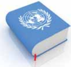
Carta de las Naciones Unidas

El Mundo de Mañana Apartado 234 6151 Santa Ana 2000 Costa Rica