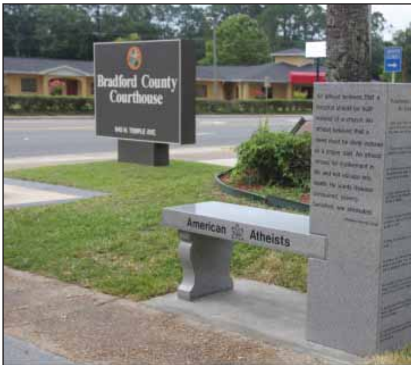
Primer monumento público al ateísmo en Bradford, Starke, La Florida, Estados Unidos.

Es importante que cada uno de nosotros aprecie la oferta que nos hace Dios de gozar de la vida eterna dentro de una sociedad enteramente nueva , que se basará en felicidad, que produce la paz e interés genuino por el prójimo (Salmos 72). Tal como se los dijo Dios a los israelitas hace tantos años, es preciso que lo busquemos con sinceridad mientras tengamos la oportunidad y que no esperemos hasta que el mundo se vea envuelto en la tribulación profetizada para los últimos tiempos. Justo antes de caer los israelitas en cautiverio, Dios les dijo: "Si desde allí buscares al Eterno tu Dios, lo hallarás, si lo buscares de todo tu corazón y de toda tu alma" (Deuteronomio 4:29).